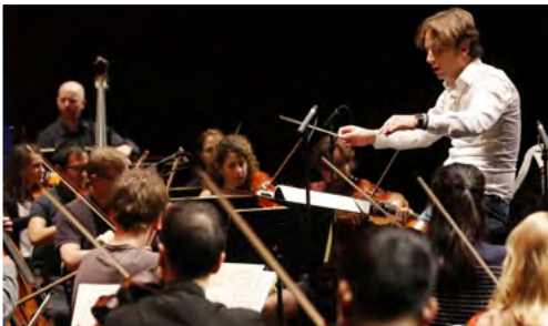
Le Cercle de l'Harmonie

Jérémie Rhorer s'est vu décerner, en 2008, le Prix « Révélation musicale de l'année » par le Syndicat de la critique ainsi que le Prix Gabriel Dussurget. Il obtient, en 2014, le Grand Prix du Syndicat de la critique puis le BBC Magazine Award en 2016.